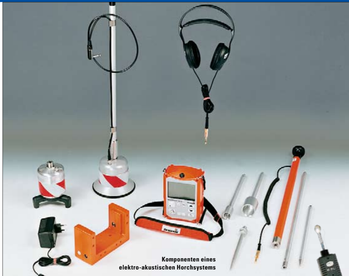
Komponenten eines elektro-akustischen Horchsystems