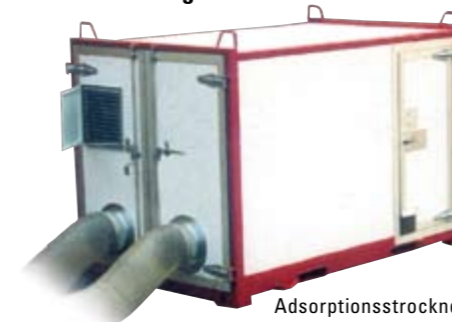
Adsorptionstrockner CTR 10.000 Für den Einsatz nach großen Wasserschäden