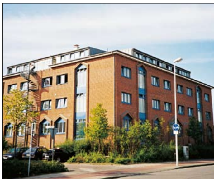
Trocknung eines Operationszentrums in Kiel im kombinierten Saug-Druck-Verfahren zur Einhaltung höchster hygienischer Vorgaben.